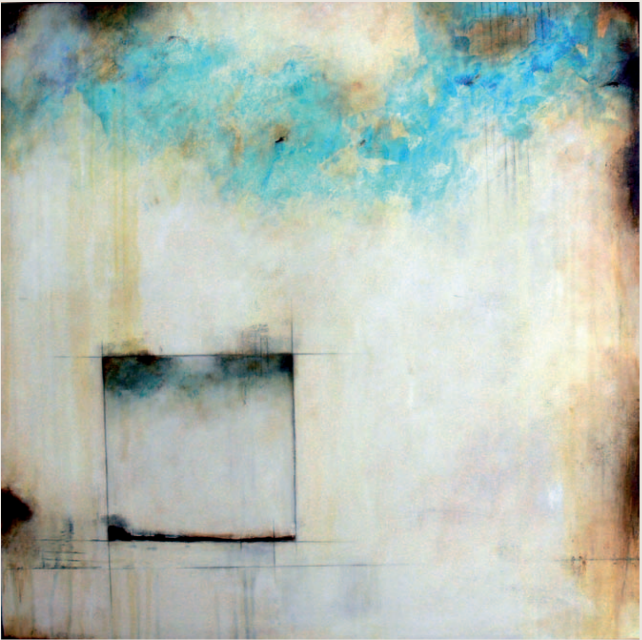
PAISAJE EN UN PAISAJE (LANDSKAP INN I ET LANDSKAP)